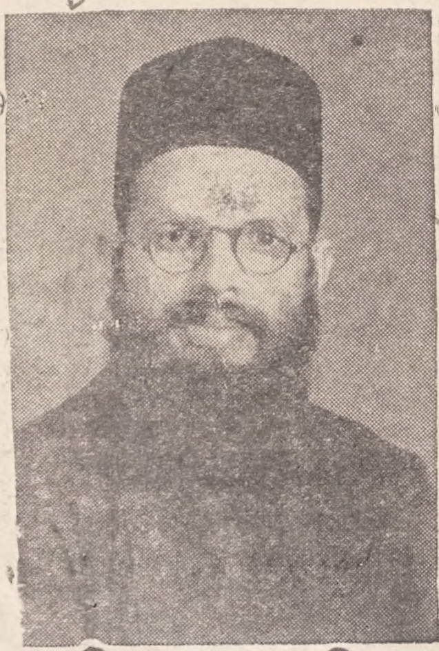
ലൂണ്ടൻ കോൺഫറൻസിൽ ലോക ക്രൈസ്തവ

(6-ാം പേജിൽ നിന്നും തുടർച്ച) ന്കോൺഫറൻസിൽ പങ്കെടുത്തതു സംബ ധിച്ചിട്ടുണ്ടെന്ന് പ്രസ്താവിച്ചത്. അദ്ദേഹത്തിന്റെ പ്രസംഗം ഇങ്ങനെ സംഗ്രഹിക്കാം.