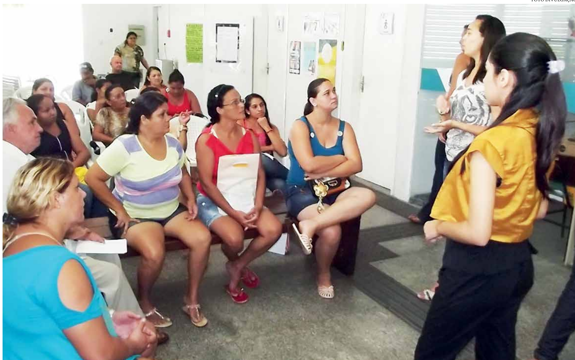
As chamadas famílias unipessoais subiram de 2,23 milhões em dezembro do ano passado para 5,32 milhões em setembro deste ano

O Auxílio Brasil, programa que substituiu o Bolsa Família no fim de 2021 e que estabeleceu um piso de benefício sem considerar a composição das famílias, tem levado a um aumento artificial do número de lares cadastrados com apenas uma pessoa. Os 5,321 milhões de famílias com uma só pessoa representam 25,7% do universo de 20,353 milhões de beneficiários. Antes, em dezembro, elas eram cerca de 15%, já em um patamar superestimado. ÚLTIMAS 8