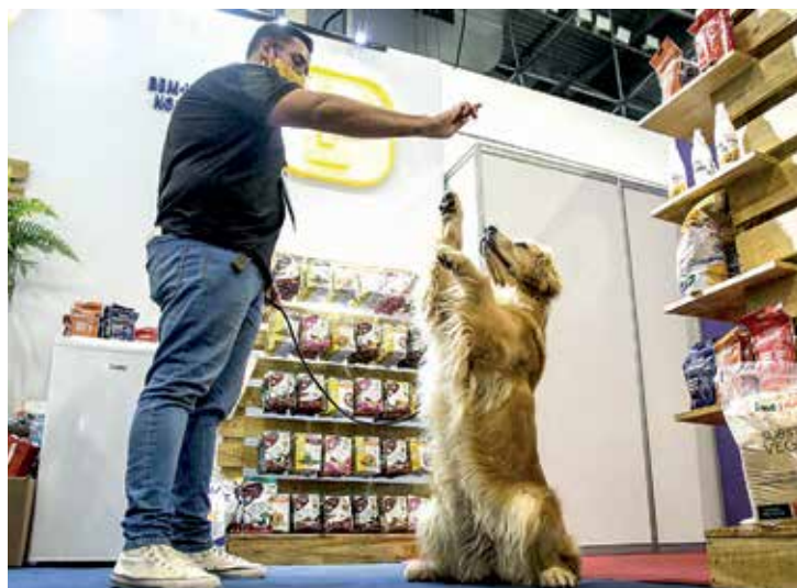
Serviços como creche, adestramento, banho e tosa ganharam projeção na pandemia. O setor projeta ainda maior

Entre os produtos adquiridos com mais frequência pelas pessoas estão compra