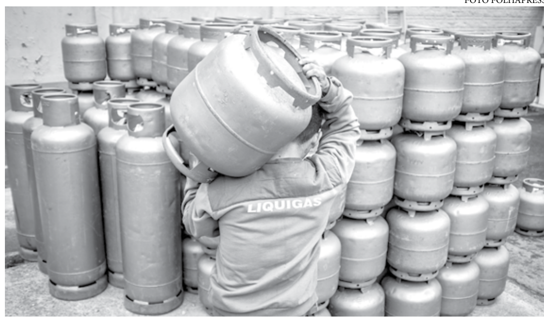
Têm direito ao Vale-gás famílias inscritas no CadÚnico com renda familiar per capita menor ou igual a meio salário mínimo

Têm direito ao Vale-gás famílias inscritas no Cadastro Único do governo federal (CadÚnico) com renda familiar per capita menor ou igual a meio salário mínimo, o equivalente, atualmente, a R$ 606 neste ano. O valor recebido pelo Auxílio Brasil não é considerado no cálculo.