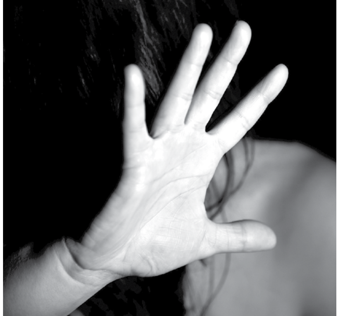
A faixa etária mais atingida foram mulheres que têm entre 35 e 44 anos

Através de um levantamento, a Casa da Mulher Brasileira divulgou que, nos primeiros 10 meses de 2022, Fortaleza teve um aumento de 11,49% em relação a 2021 no número de atendimentos a mulheres vítimas de violência doméstica. De acordo com os dados divulgados, entre janeiro e outubro, contabilizaram-se 65.663 atendimentos.