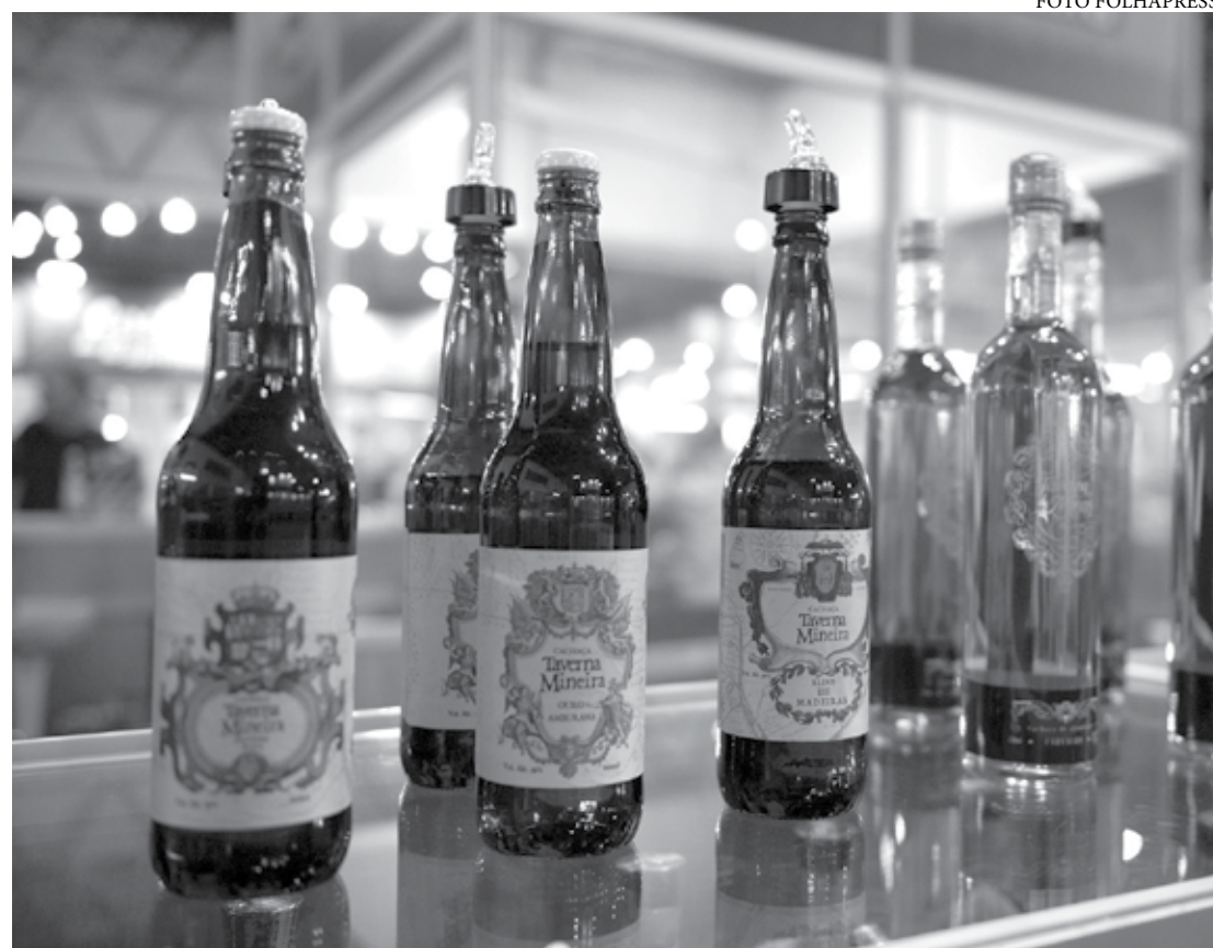
Os números de 2022 já superam o de 2019, ano pré-pandemia quando o setor registrou US$ 14,60 milhões em exportação

Atualmente, a cachaça brasileira é exportada para 72 países. Em termos de valor exportado, os principais são os Estados Unidos, Alemanha, Portugal, Itália, França e Paraguai. Portugal, por exemplo, mais que dobrou nos valores de cachaça importada do Brasil e a Itália