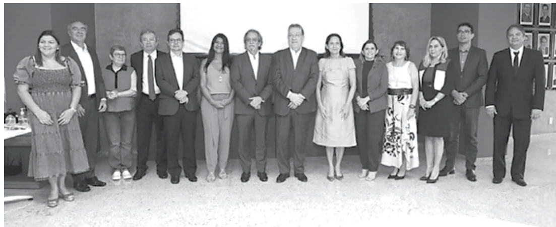
A governadora Izolda Cela; a secretária da Educação, Eliana Estrela; o secretário da Controladoria e Ouvidoria, Aloísio Carvalho; o presidente do TCE Ceará, Valdomiro Távora; e o presidente do IPC, Ernesto Saboia; participaram do encontro, entre outras autoridades

pais atribuições dos Tribunais de Contas, no que diz respeito à fiscalização dos recursos públicos, ao fomento à transparência e ao controle social. Desta forma, busca-se desenvolver o pensamento crítico e o protagonismo dos jovens, por meio do exercício mais pleno da cidadania.