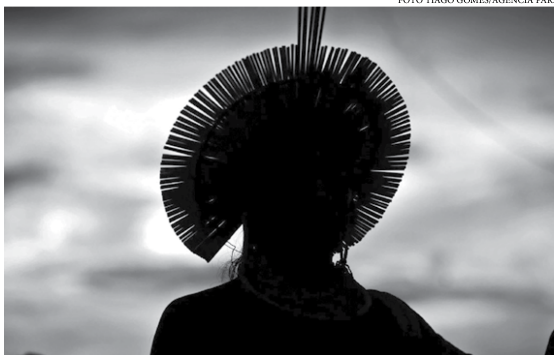
A Amazon Watch estima que os rejeitos tóxicos devem contaminar pelo menos 41 km do rio Xingu

De acordo com a empresa, há o objetivo de “manter o impacto ambiental no mínimo” e, em sua página oficial, é destacado o compromisso com as comunidades dos locais onde ela atua. Na conferência, a Amazon Watch apresentou um relatório sobre os impactos de tal projeto de mineração. A meta principal é impedir que investidores queiram financiar a ideia da Belo Sun. Entre os pontos abordados no relatório, ressalta-se a