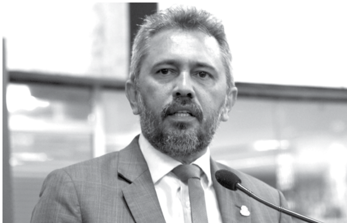
Os nomes do secretariado de Elmano de Freitas (PT) para 2023 serão anunciados ainda este mês

Isso se dá com mais força na Assembleia Legislativa do Ceará (Alece), onde