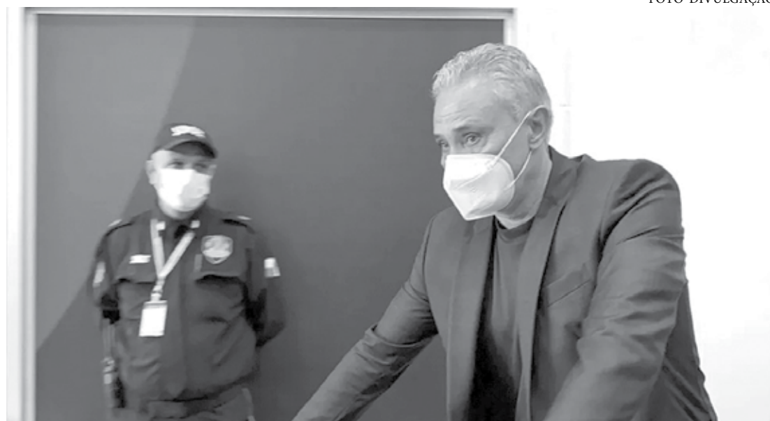
Na chegada, Tite visivelmente emocionado foi aplaudido pelos presentes no saguão, mas não deu entrevistas

Segundo relatos de quem estava no aeroporto, desembarcaram no Brasil os jogadores Éverton Ribeiro, Ederison, Weverton, Raphinha, Danilo e Rodrygo. Éverton foi o único a falar no desembarque. "Ainda é tudo muito recente, todo mundo frustrado, triste. A gente não espe-