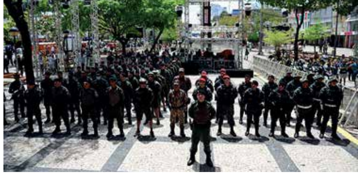
Agentes de segurança durante o lançamento da força-tarefa

A Polícia Militar atua com agentes do Comando de Policiamento de Rondas e Ações Intensivas e Ostensivas (CPRaio), Comando de Policiamento de Choque (CPCoque), Regimento de Polícia Montada (RPMont) e 5º Batalhão de Polícia Militar (BPM). Os profissionais trabalham de forma coordenada e por meio