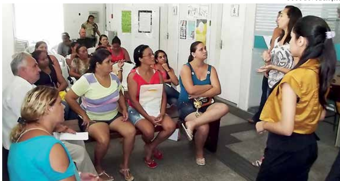
Os 5,321 milhões de famílias com uma só pessoa representam 25,7% do universo de 20,353 milhões de beneficiários

MAIS CONTEÚDO ACESSE www.oestadoce.com.br