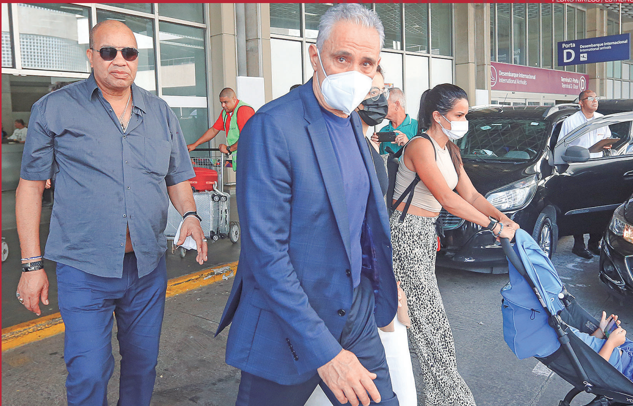
PEDRO KIRILOS / ESTADÃO