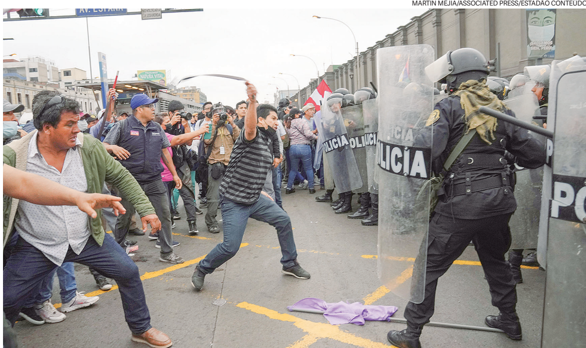
Apoiadores do ex-presidente Pedro Castillo e soldados da tropa de choque se enfrentam