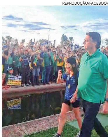
Emoção: Bolsonaro e menina passearam em frente ao Alvorada

Ao final, o presidente apenas desejou "boa noite" aos bolsonaristas