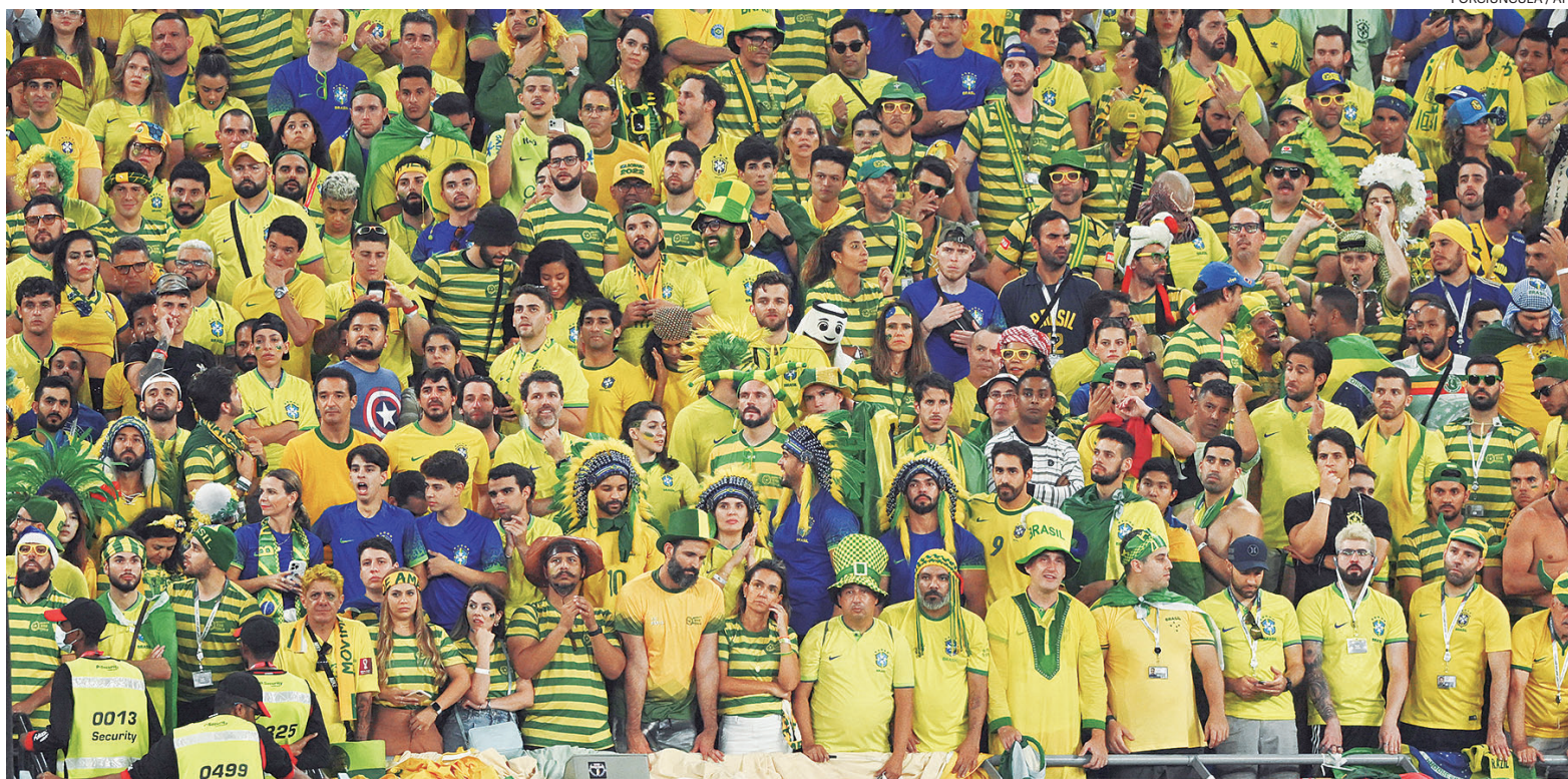
Ao contrário dos voos na ida tomados por gritos de hexa e cantos em favor da seleção, desta vez os torcedores optaram por algo mais sóbrio