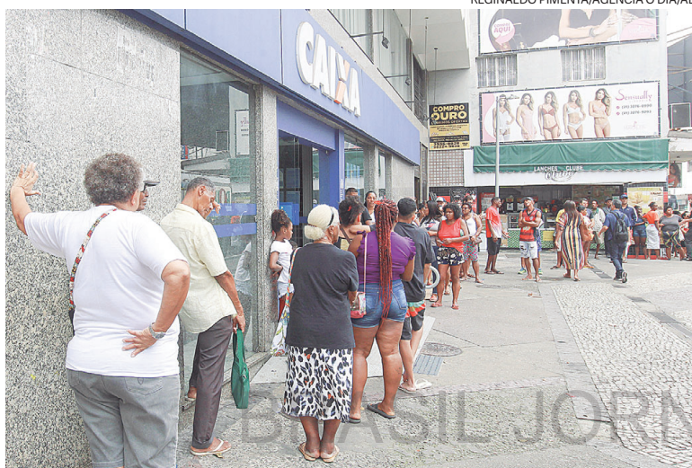
Após eleição, aumentou o número de pessoas nas filas do benefício

Bolsonaristas reconheciam que a medida era uma das principais apostas eleitorais da campanha. Também lamentavam que a am-