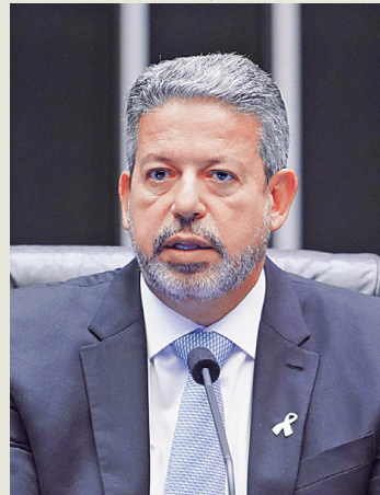
Lira discutiu PEC ontem com parlamentares do PT

texto da Comissão de Constituição e Justiça (CCJ), em meio à pressão da oposição para reduzir o impacto e o prazo de duração.