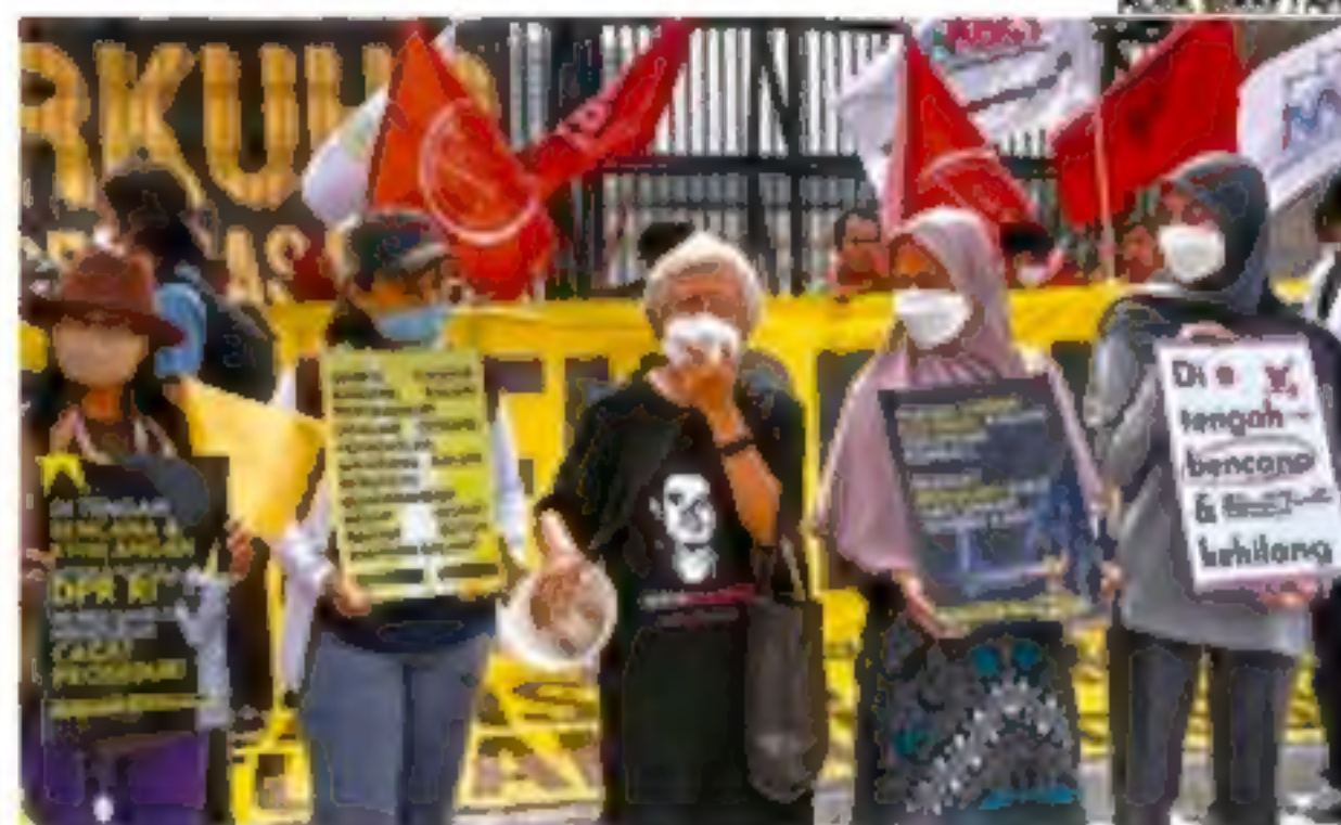
Protestos contra a mudança na lei acontecem na capital Jacarta