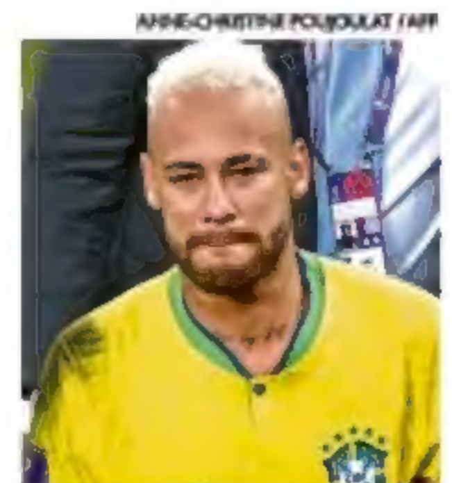
De volta ao Brasil, Neymar expõe os lamentos pela eliminação

Principal estrela da Seleção, Neymar também está em solo brasileiro, como confirmou em suas redes sociais. Ele publicou mensagens trocadas com os jogadores Marquinhos, Thiago Silva e Rodrygo, lamentando a eliminação. No Instagram, Neymar escreveu: "Decidi expor (sem a permissão deles) pra verem o quanto queríamos e o quanto estávamos unidos... Sentimento de muita tristeza...".