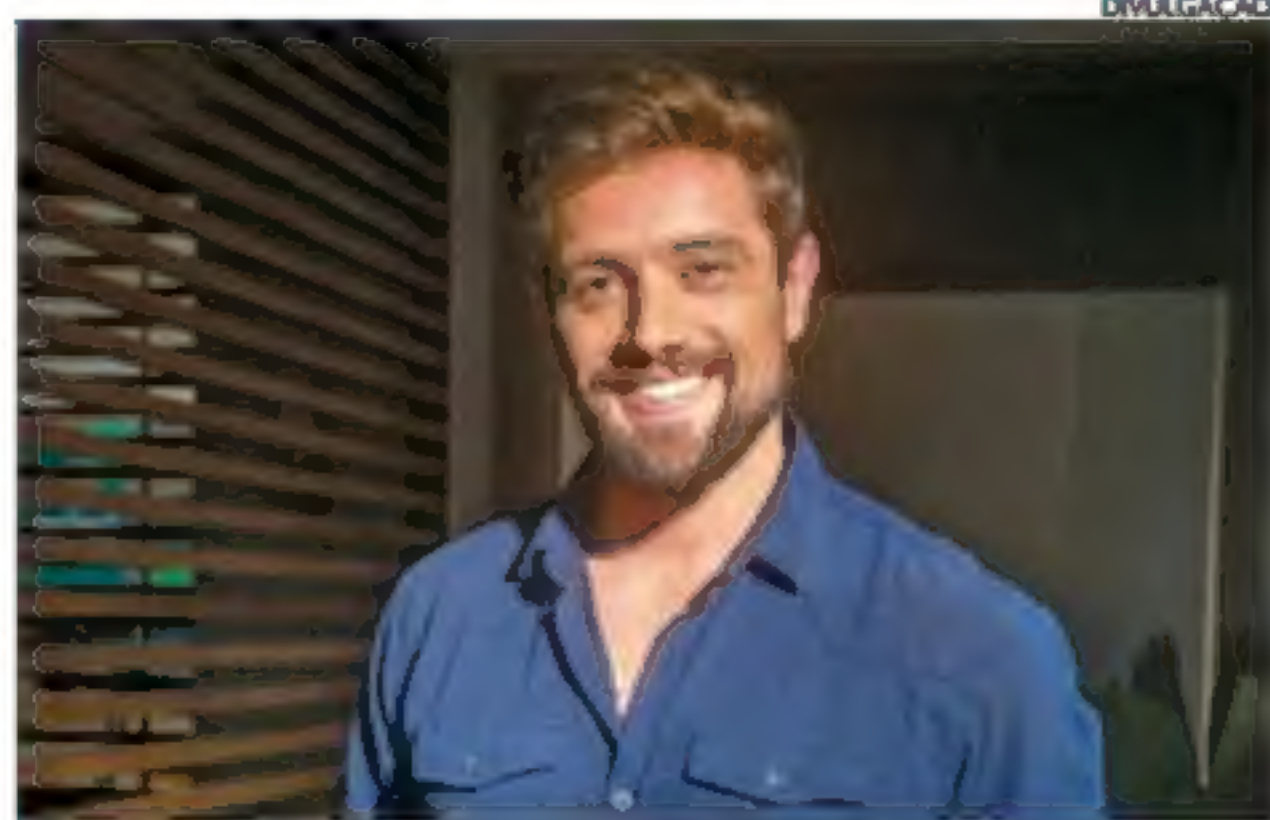
Ator comemora a volta das gravações presenciais em estúdio