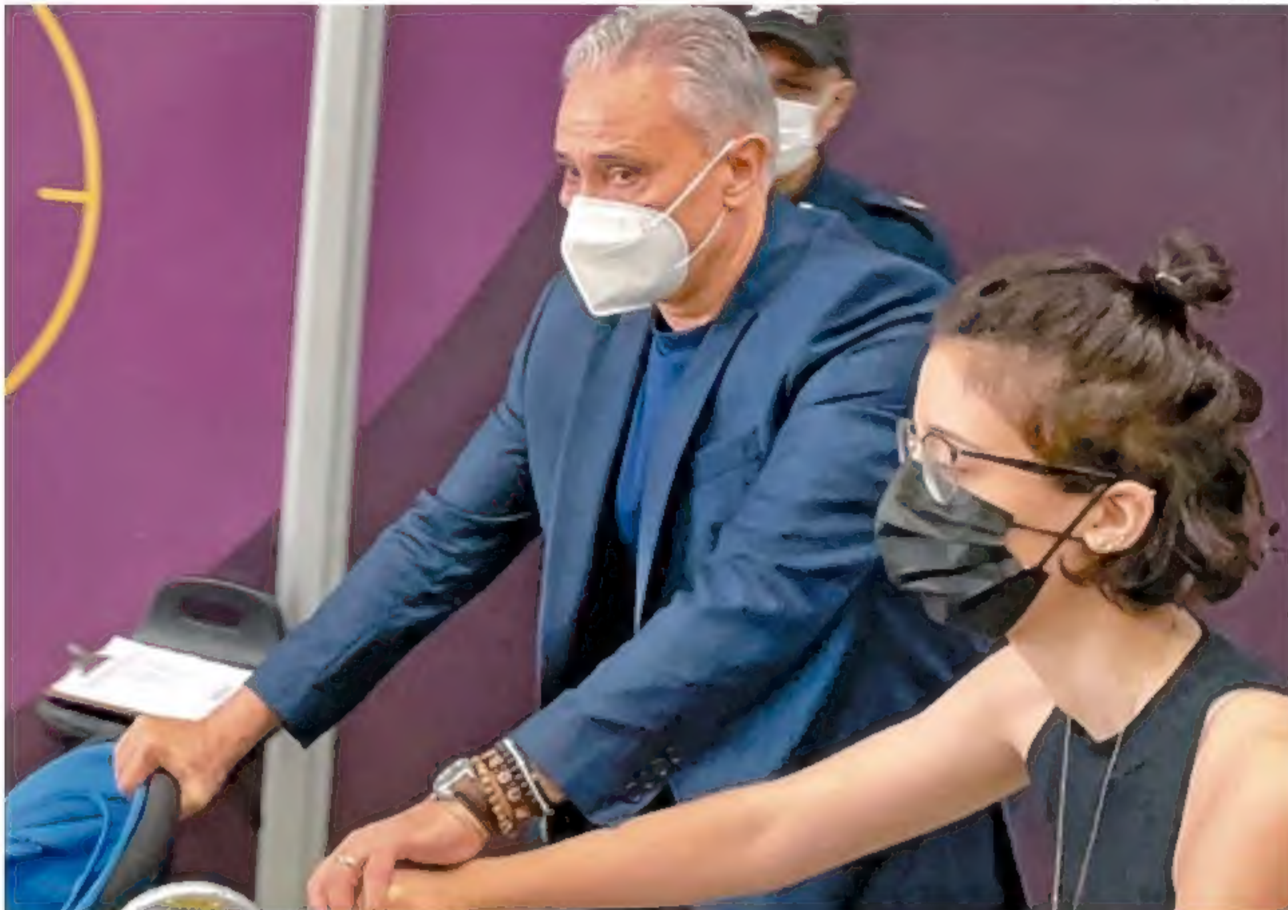
Tite desembarcou no Galeão, no Rio de Janeiro, bastante emocionado. Ele já confirmou que não continuará o comando da Seleção Brasileira