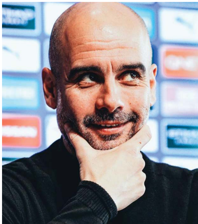
Pep Guardiola comanda o Manchester City desde 2016

Segundo o portal, a CBF irá fazer uma "limpeza profunda" em todo departamento de futebol, após a saída de Tite. Junto ao ex-técnico, todos os membros da comissão técnica e o coordenador Juninho Paulista também devem deixar os cargos.