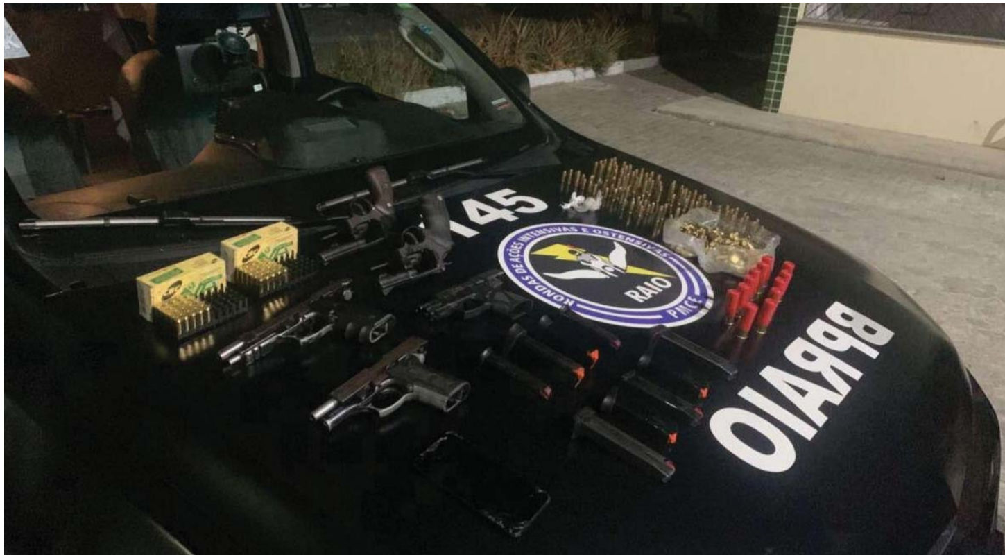
Armas de fogo, munições e explosivos foram apreendidos com os suspeitos