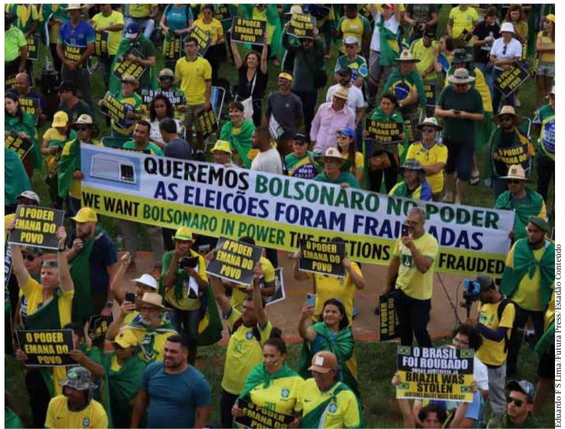
Eduardo F S Lima Futura Press/Israão Contreido

Os protestos contra a condução das eleições no Brasil começaram em 30 de outubro, após Lula ter sido declarado eleito. Naquela noite, caminhoneiros começaram a bloquear rodovias em