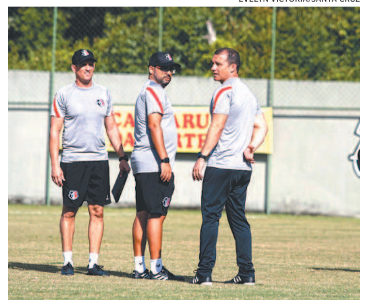
Santa Cruz realizou três jogos-treino em oito dias

“Principalmente no primeiro tempo, o jogo ficou limitado, amarrado. A temperatura influencia demais, justamente para não perder a luz do sol. Então, para o jogo em si, está sendo uma prova, para a questão técnica da coisa. A gente está perdendo um pouco por causa da temperatura muito