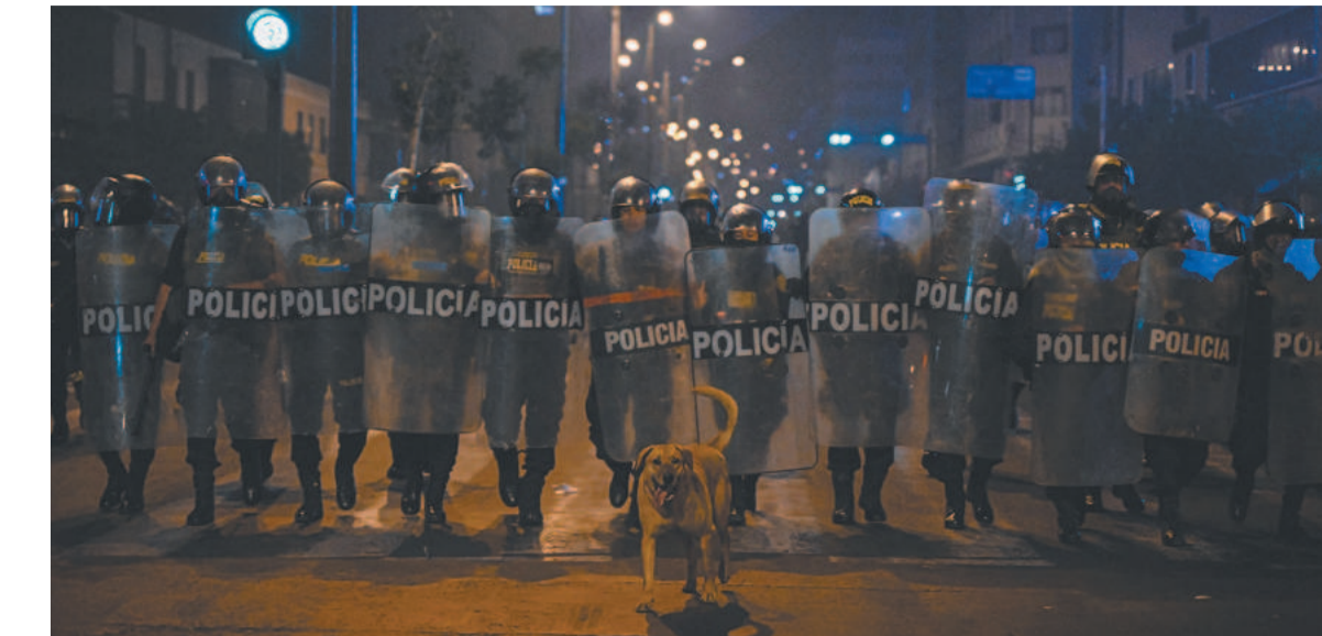
Mobilização mostrou crescimento e atos chegaram ao quarto dia seguido no país

Reforços do batalhão de choque chegariam a esse terminal para conter os milhares de manifestantes em Andahuaylas, localizada na região de Apurímac, cidade natal de Dina Boluarte. Pessoas atacavam com estilingues e pedras, enquanto as forças de segurança as repeliam com gás lacrimogêneo, segundo imagens divulgadas pela imprensa.