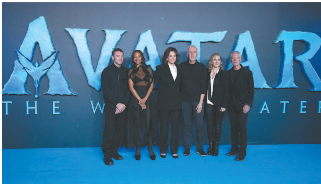
“Avatar” tem a maior bilheteria da história e receita em torno dos US$ 3 bilhões

A mensagem ecológica é um dos pilares do extraordinário sucesso de Avatar . O filme tem a maior bilheteria da história e sua receita é de aproximadamente três bilhões de dólares,