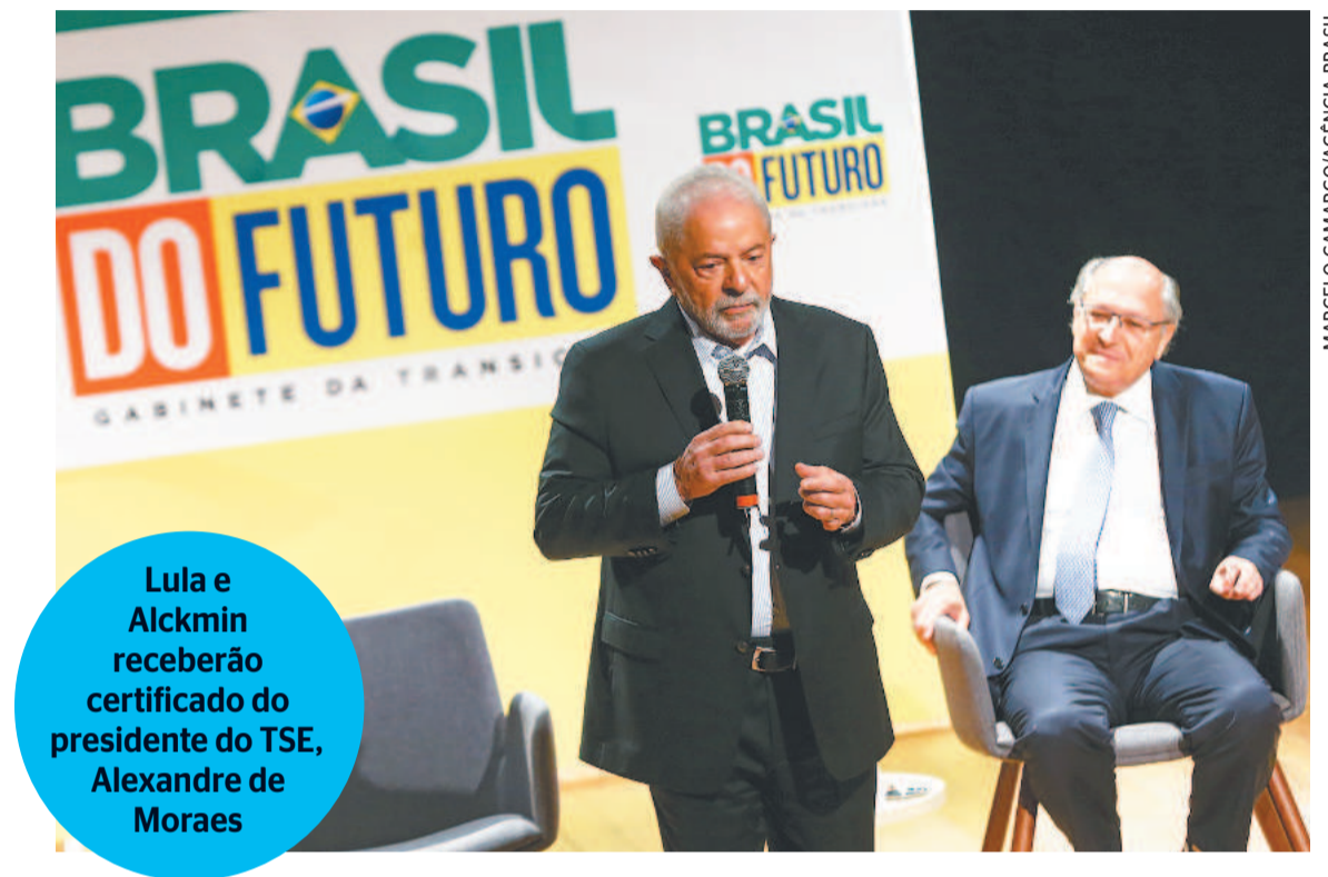
Lula e Alckmin receberão certificado do presidente do TSE, Alexandre de Moraes

A diplomação emocionada do presidente eleito do Brasil, em 2002, comoveu o país em geral e os políticos. Um deles foi o deputado Valdemar Costa Neto, que já era presidente do PL, atual partido do presidente Jair Bolsonaro. O parlamentar confessou-se emocionado com o discurso de Lula, dizendo que ele resumiu o sentimento de muitos brasileiros que não têm acesso à educação. O ex-governador do Rio de Janeiro Leonel Brizola, um dos fundadores do PDT, considerou as palavras de Lula uma espécie de resposta e